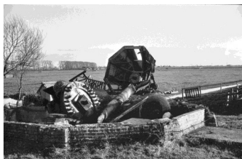
De restanten van de in 1972 door de storm gevelde Polslootpoldermolen

De Polslootmolen staat op een kaart van Utingeradeel uit 1849. De molen heette ook wel de Spookmolen en bemaalde de achterliggende polder. In 1947 werd besloten de molen te vervangen door een elektrisch aangedreven gemaal . Toestemming werd gevraagd om de molen te slopen, maar die werd geweigerd, zoals ook in 1952 gebeurde. De molen werd in 1961 en 1971 gerestaureerd. In een zware novemberstorm werd in 1972 de molen omvergeblazen . In 1976 werd de molen herbouwd voor een bedrag van fl 80.000,-.