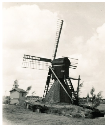
De Polsslootmolen op de oorspronkelijke locatie met het in 1947 gebouwde elektrisch gemaaltje en op de achtergrond de kerktoeren van Akkrum.

De molen was destijds eigendom van de gemeente Utingeradeel en stond juist ten zuiden van de toenmalige mengvoederfabriek UTD .