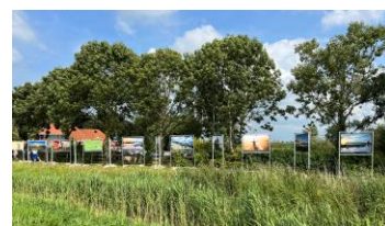
Fototentoonstelling op de polderdijk