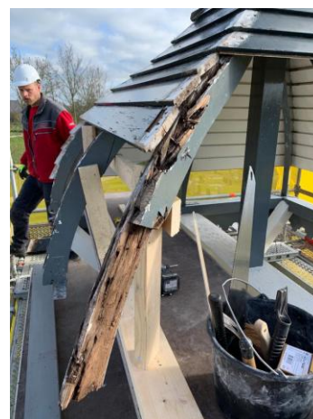
Herstel kap klokkenstoel Nes