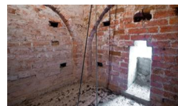
Schoonmaken zolders Eagum