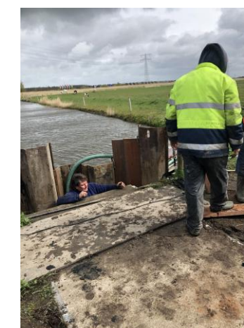
Groot onderhoud uitstroombak Himpenserpoldermole