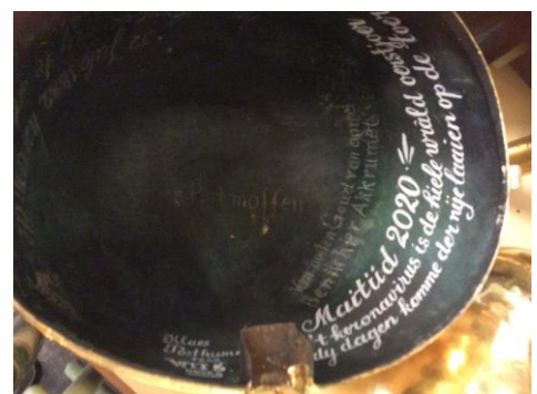
RESTAURATIE 2020 KERKTOREN AKKRUM, DE VERGULDE EN OPENGESLAGEN PIJNAPPELBOL MET ACTUELE TEKST