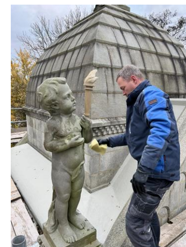
Reconstructie toorts Mausoleum