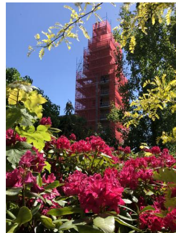
Restauratie toren Akkrum