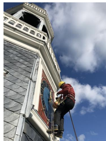
Herstel wijzerverlichting Aldeboarn